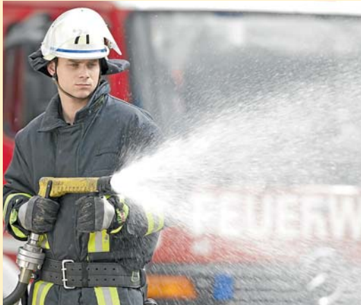
1 Löschen mit Wasser