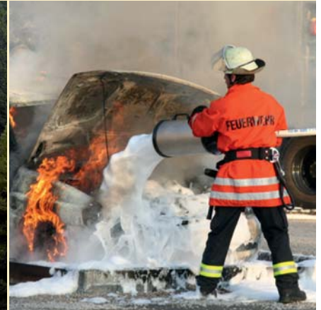
3 Ersticken mit Schaum

Es ist nützlich, wenn man weiß, wie man ein Feuer macht. Ebenso wichtig ist es aber zu wissen, wie man ein Feuer löscht. Das Prinzip des Feuerlöschens ist ganz einfach: Entziehe dem Feuer eine der drei Bedingungen, die für eine Verbrennung notwendig sind, dann erlischt das Feuer.