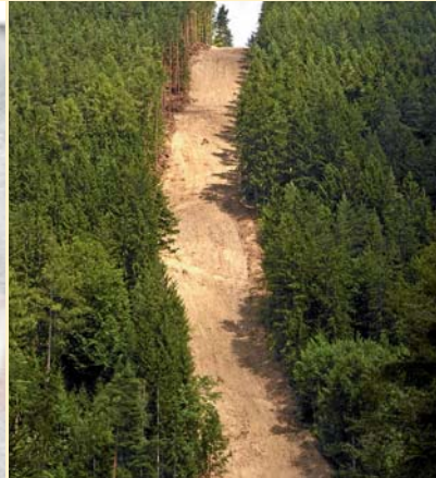
2 Brennstoff-Entzug durch Schneisen