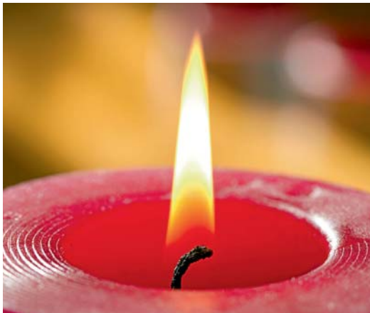
1 Flammen sind brennende Gase.