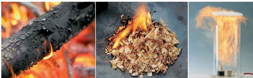
2 Mit zunehmendem Zerteilungsgrad lässt sich ein brennbarer Stoff leichter entzünden.